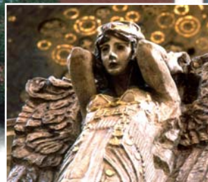
Figur in der Kirche St. Josef

dach ist, lässt es sich entspannt spazieren gehen. Am Rande der Altstadt findet man eines der bemerkenswertesten Bauwerke der Stadt: die katholische Stadtpfarrkirche St. Josef, außen neoromanisch, im Inneren, ganz ungewöhnlich, ein Juwel des Jugendstils. Dieser Stil prägt auch etliche Straßen in