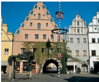
Unterer Markt mit Mauermann-Brunnen

pfalzgräfliche, Halbscheid, endgültig an Pfalz-Sulzbach. Weiden wurde dann 1777 Bestandteil des Kurfürstentums und 1806 des Königreichs Bayern.