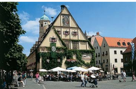
Das "Alte Rathaus" im Renaissance-Stil

Viele Zeugnisse aus ihrer Vergangenheit haben sich in der heute so lebhaften Stadt erhalten: die evangelisch-lutherische Stadtpfarrkirche St. Michael mit ihren romanischen und gotischen Wurzeln in unmittelbarer Nachbarschaft zum Alten Rathaus, gleich daneben das mächtige "Alte Schulhaus" aus dem 16. Jahrhundert mit Stadtarchiv, Stadtmuseum, Max-Reger-Sammlung, Städtischer Galerie und Tachauer Heimatmuseum und das "Veste Haus", ab 1493 Sitz der landesherrlichen Verwaltung und von 1585 bis 1593 auch Residenz. An den Resten der Stadtbefestigung entlang, deren Glanzpunkt das Untere Tor mit seinem spitzen Helm-