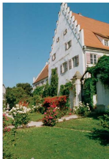
Rosenschloß Schlachtegg, heute süddeutsches Floristenzentrum

Das Rathaus, die Türme der Pfarr- und Spitzkirche, das Kulturzentrum Walkmühle, die malerische Innenstadt und Teile der Stadtmauer zeugen heute noch von der mittelalterlichen „Herrlichkeit“ der Donaustadt und sind wunderbare Schmuckstücke des historischen Stadtbildes.