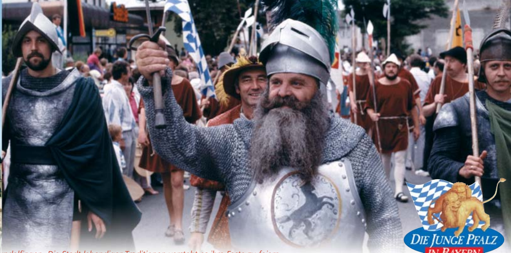
Gundelfingen. Die Stadt lebendiger Traditionen versteht es ihre Feste zu feiern