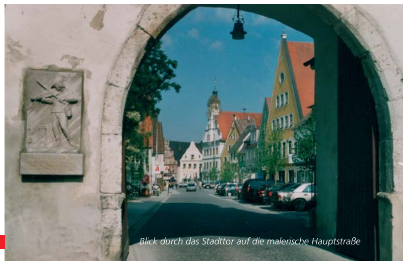
Blick durch das Stadttor auf die malerische Hauptstraße

Nach dem Tode Herzog Georg des Reichen brach ein Erbfolgekrieg aus, der mit der Bildung des Fürstentums Pfalz-Neuburg im Jahre 1505 endete. Durch den "Kölner Spruch" wurde auch Gundelfingen Bestandteil der „Jungen Pfalz“. Hier blieb es auch, bis im Jahre 1777 sämtliche bayerischen Lande unter Kurfürst Karl Theodor wieder vereinigt wurden.